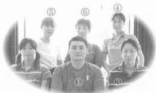
愉快などんぐりの仲間たち