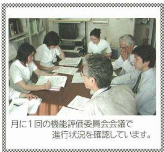
月に1回の機能評価委員会会議で進行状況を確認しています。

医療安全管理委員会・診療録管理委員会・感染防止委員会・感染性廃棄物管理委員会・薬事委員会・検査適正化委員会・労働安全衛生委員会・給食委員会・褥瘡委員会・教育委員会・医療ガス安全管理委員会・病院機能評価委員会などです。