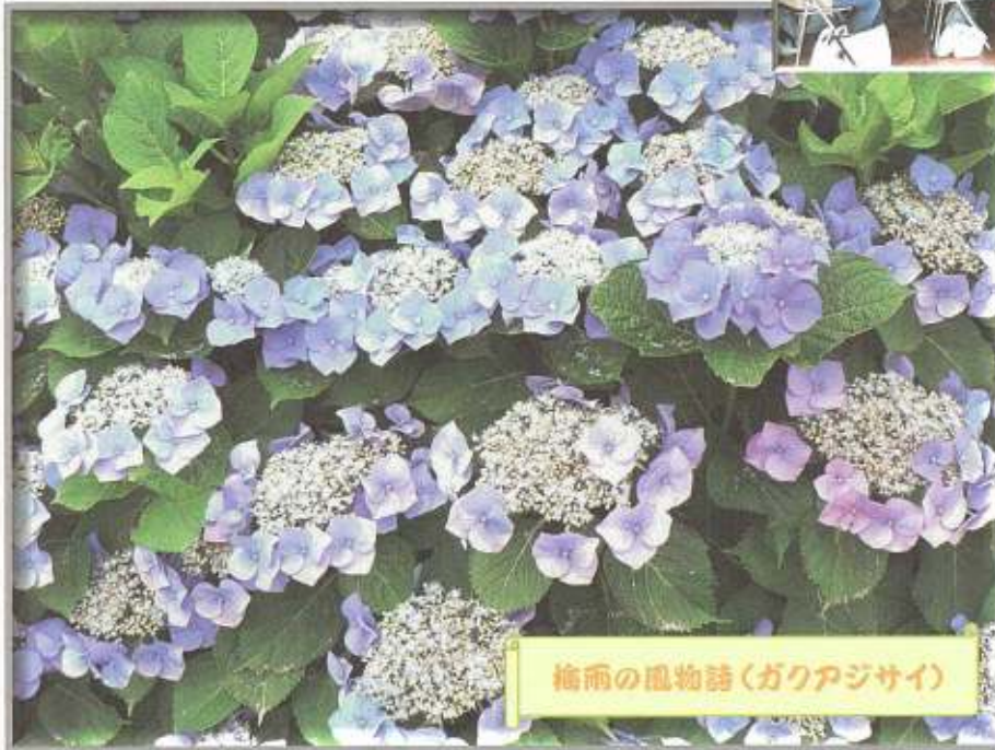
梅雨の風物詩(ガクアジサイ)