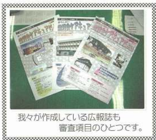
我々が作成している広報誌も審査項目のひとつです。

《ちょっとお知らせ》 病气・介護のことでお困りの方、お気軽に加野病院までご相談下さい。