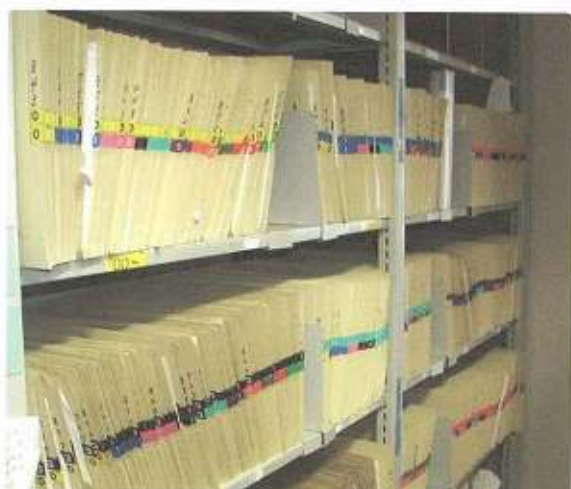
診療録(カルテ)の整理も重要な課題の一つです。