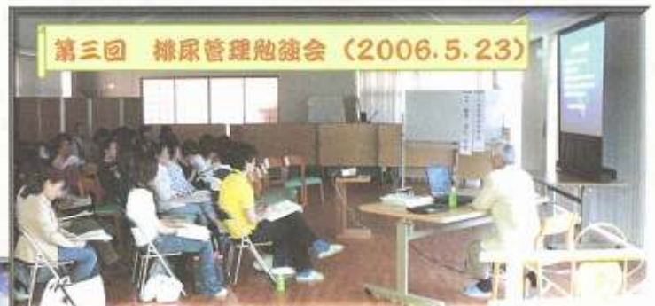
第三回 排尿管理勉強会 (2006.5.23)