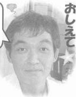
テーマは「腎臓」 副院長