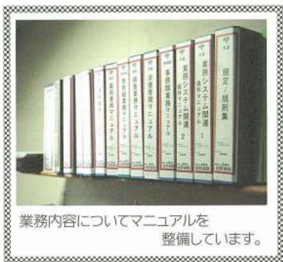
業務内容についてマニュアルを整備しています。

私たちは、「迅速・正確・気配り」をモットーに、より安全で信頼される医療を提供できる病院を目指して、いろいろな取組みを継続していきます。