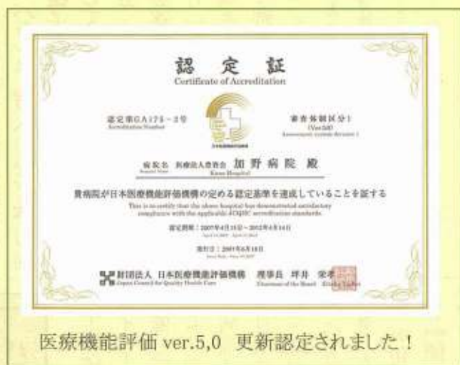
医療機能評価 ver.5.0 更新認定されました!

外来診療時間のご案内(日曜・祝祭日休診) 午前 9:00~12:30(受付は12:00まで) 午後 13:30~17:30(受付は17:00まで)