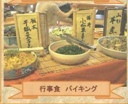
行事食 バイキング