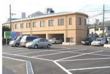
新宮方面から右側・福津方面から左側

従来の駐車場は今年の夏に竣工予定の高齢者用貸貸マンション【ルーエハイム】の建設工事のため閉鎖して、新駐車場を準備致しました。(33台収容) ※：ルーエハイムとは、ドイツ語で、「ルーエ」は安心、「ハイム」は家という意味です。 (ルーエハイム)は心は5階建一部3階の26戸(11戸)