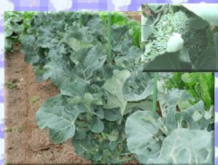
「ガーデンあい」“旬花”だより ブロッコリー