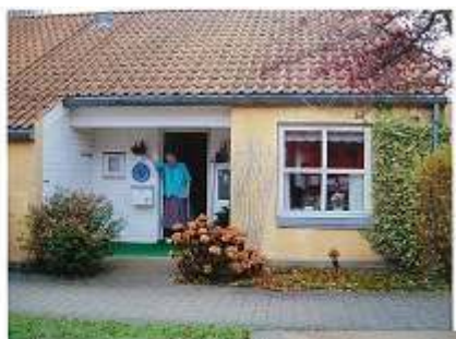
↑デンマークの地域ケア総合センターの高齢者住宅室内。

2003年11月に福祉研修でデンマークを訪れました。1週間に13箇所を回るハードなスケジュールでしたが、「施設から住宅」と方針を変えた福祉先進国の取り組みに刺激を受けた貴重な時間でした。国民性の違いはあるにせよヘルパーや訪問看護、移動用の器具などに助けられ自分らしく住み続ける大勢の高齢者に出会い、感動が溢れました。