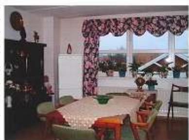
↑デンマークのコレクティブハウス(1軒に6名の方が居住)の個室室内。

考える中「自分や家族が心から受けたいと思えるサービス」は何だろうかと自問自答してきました。住み慣れた家や地域で最後まで暮らすことができればどんなにいいだろうかと思えます。