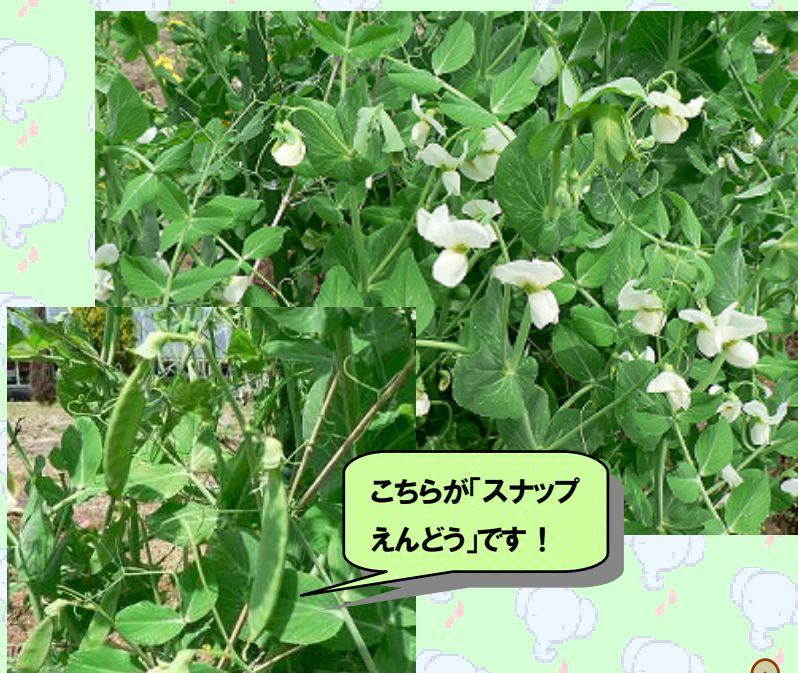
こちらが「スナップ えんどう」です!