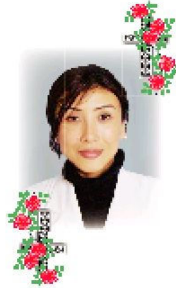
日本泌尿器科学会指導医・専門医