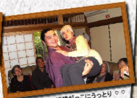
念願のお姫様だっこにうっとり♡♡