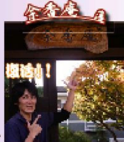
"余香庵部"構想の仕掛人