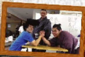
無謀なるチャレンジ...

九州場所を終えた湊部屋の力士が、豊資会の介護施設に慰問に来てくださいました。もちろん施設のお年寄りは大喜び! 写真撮影も大賑わいでした!