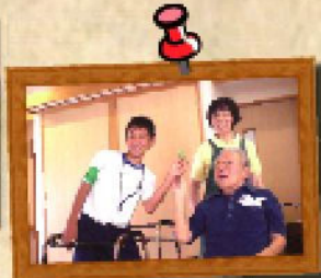
中学生のみなさん、夢に向かって頑張ってください!