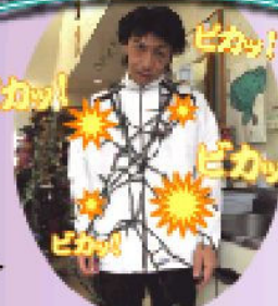
リハビリセンターはなみの連れてきた大器