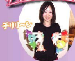
デイサービス花梨のおやじキター