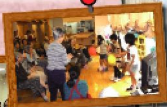
ご入居者も大喜び!