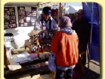
色々な木工作品を販売しました!