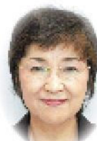
社会福祉法人豊資会