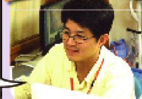
ルーエハイム安心の知略の将