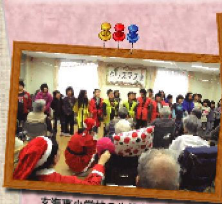
玄海東小学校の生徒さんが、クリスマス会で出し物を披露してくれました!

ハイマートどんぐりの森とハイマート杏では近隣の小学生と定期的なふれあい交流しています。施設のお年寄りも元気な子供たちがやってくるのをとても楽しみにしています!