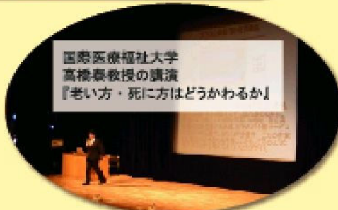
国際医療福祉大学 高橋泰教授の講演 『老い方・死に方はどうかわるか』