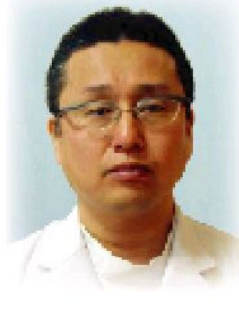
日本泌尿器科学会指導医・専門医