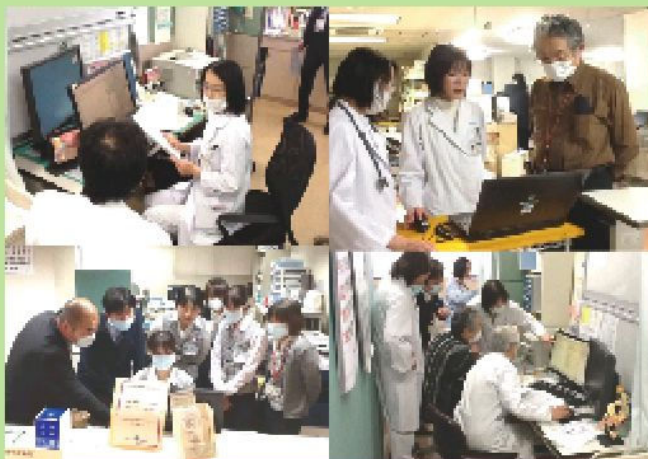
スルーテストの様子。みんな真剣です!!

やまびこ診療所に新たに導入したことで、加野病院とやまびこ診療所のより一層の連携が図れるようになりました。また、やまびこ診療所には同時にモバイル電子カルテシステムも導入し、訪問診療の際に患者様のご自宅にて電子カルテシステムが利用可能になりました。