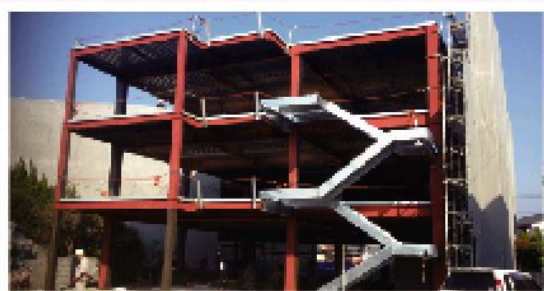
3月下旬の工事の様子。