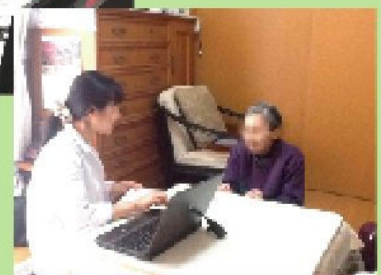
患者様のご自宅でもカルテ入力!!