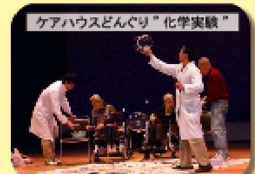
ケアハウスどんぐり”化学実験”