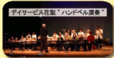
デイサービス花梨”ハンドベル演奏”