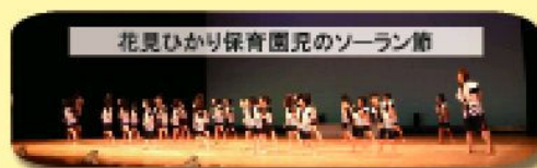
花見ひかり保育園児のソーラン節