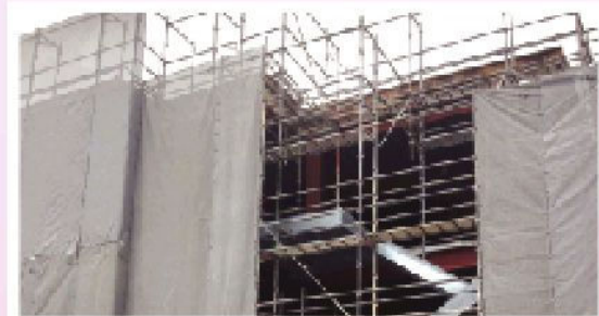
4月中旬。シートに覆われて中は見えませんが作業は着々と進んでいます。