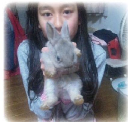
齊田家の一員となったウサギと 齊田技師長の娘さんとのショット

ちなみに私はオオクワガタの世話が忙しいので、あまり面倒は見れませんが・・・!クワガタの話は今回の紙面には収まりきらないので、また次の機会ということで悪しからず(笑)。