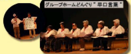
グループホームどんぐり”早口言葉”