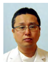
日本泌尿器科学会指導医