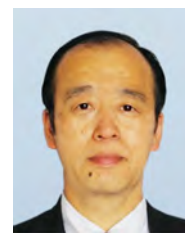
ハイマート桑の実