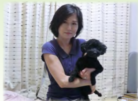
コタロウ君と一緒に

デイサービス職員の間では「美人で頼れるお姉さん、顔に似合わず大きな声、握力が強い」と評判の職員です。どんぐりに来られた際は声をかけてください。