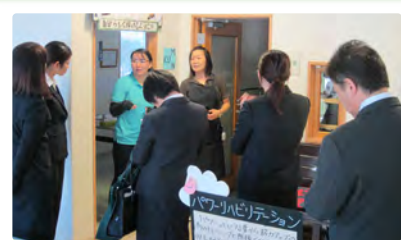
施設見学でも真剣な表情で熱心に耳を傾けていました。