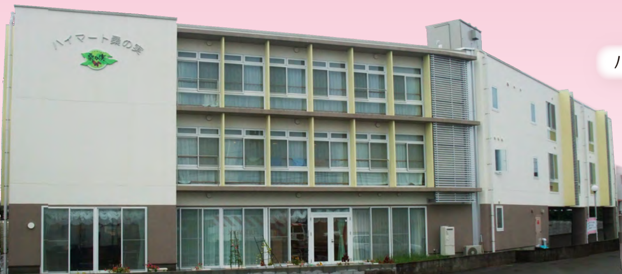
ハイマート桑の実