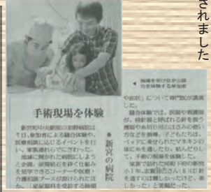
七夕祭の様子が読売新聞に掲載されました

今年1月に新宮町に移転した加野病院では、地域の皆様に早く施設の名称や場所を覚えて頂けるよう、七夕祭を開催しました。