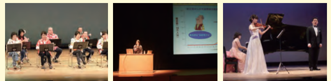
※写真は去年の文化祭の様子

今年で第4回目となる豊資会グループ文化祭を来る1月18日に開催します。今回のテーマは『感動』。ご利用者やご家族に達成感や喜びを感じて頂くのはもちろんのこと、ご観覧の皆様にも感動を味わって頂きたいと思っています。ご期待下さい！