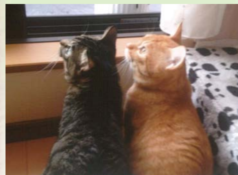
■左が「しんさくさん」右が「りょうまさん」

平成24年10月、我が家に二匹の兄弟猫がやってきました。茶色が「りょうまさん」、黒が「しんさくさん」です。「さん」までが名前!と家族に言い続け今では皆が呼んでいます。「りょうまさん」は甘えん坊でべったりと抱き着くように引っついてきます。寝ている時にゆすっても起きない事もあるほど気の大きい所があります。「しんさくさん」は人見知りで我が家に来て1年以上経ってやっと膝に乗ってくるようになりました。正反対の二匹ですが一つ一つのしぐさに癒される毎日です。