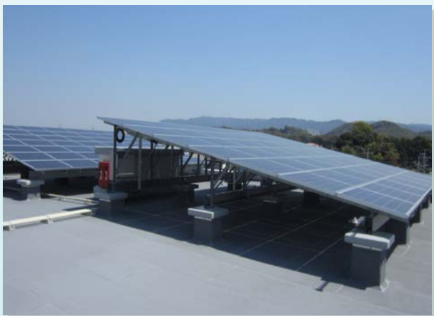
■屋上に設置された太陽光発電パネル