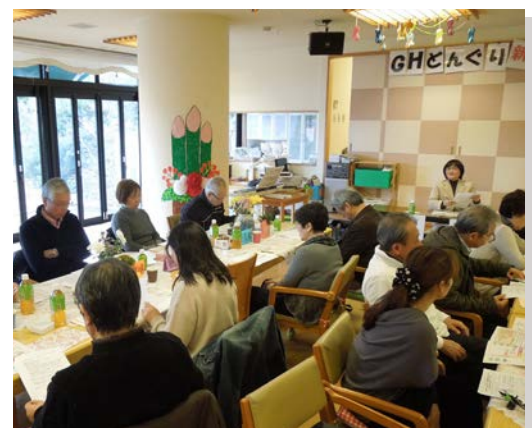
■家族会当日の様子。ご家族の方々も真剣に耳を傾けていらっやいました。

の法律行為に同意を与えたり、本人の同意のない不利益な法律行為を後から取り消すなど、本人を保護・支援します。