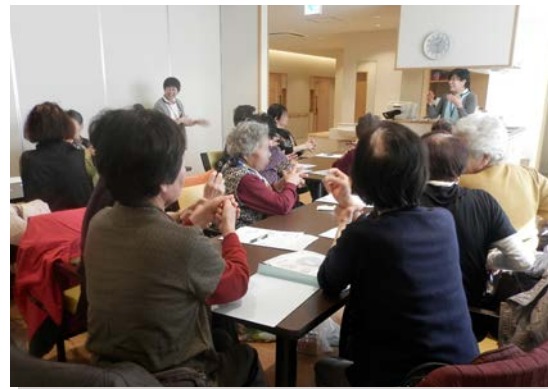
■手洗い講習を受講する夜白老人クラブ女性会員の皆さん。和気藹々と楽しく受講していただきました。

など、泌尿器科を受診するまでには至らない場合や、相談し辛いこともあるようで、常々気になっていった症状の質問がありました。