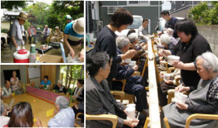
古賀市今の庄 1・2・12 小規模多機能型居宅介護 余香庵

なかでも「わいわいピンポン」はみなさま生き生きとプレイされ、職員も驚くほどの上達ぶりです。「この姿を是非、ご家族にも見て頂きたい」との思いから、今年の行事は『ご家族もご一緒に』をスローガンに企画・実行しています。ご期待ください。