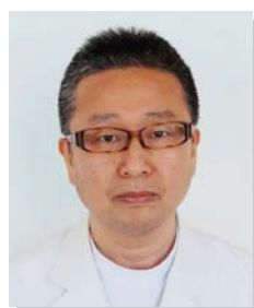
日本泌尿器科学会指導医・専門医