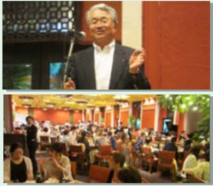
海の中道ホテルルイガンズ

8月、豊資会グループでは毎年恒例の納涼会を開催しました。この会は職員だけでなく、職員の家族も招待しています。今年は海の中道のホテルにて行いました。参加者の数も例年より大幅に増えて、320名ほどが集まりました。