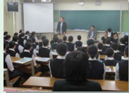
学校法人博多学園 博多高等学校

8月17日、博多高等学校にて来年3月ご卒業予定の看護専攻科の学生の皆様を対象とした豊資会グループ法人説明会を実施いたしました。