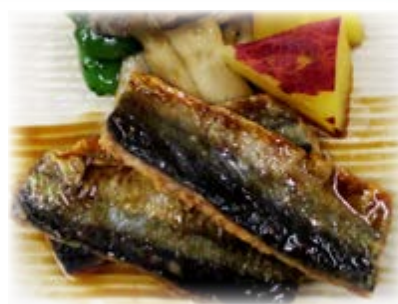
さんま 秋刀魚の ウスターソース焼き