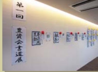
デイサービス新宮中央

デイサービス新宮中央では、レクリエーションの一環として書道教室を一年程度継続的に行っています。 練習を継続していく中で、ご利用者様が大変に上達されたこともあり、日々の練習の成果を発表する機会を設けようと、書道展を開催いたしました。