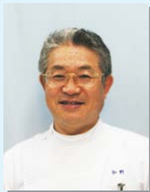
豊資会グループ 代表 医療法人豊資会