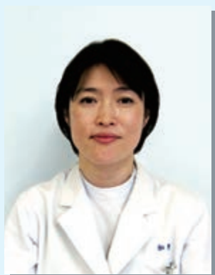
医療法人豊資会 加野病院