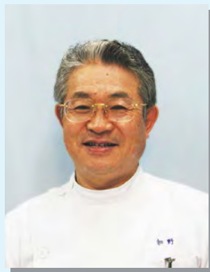
豊資会グループ 代表 医療法人豊資会