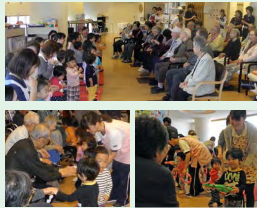
デイサービス新宮中央

11月、デイサービス新宮中央に、新宮あおぞら保育園の元気な園児のみなさんが交流に来てくださいました。デイサービス新宮中央、加野病院リハビリセンターのご利用者様が童謡でお出迎えすると、園児のみなさんは音楽に合わせてふれあいゲームでたくさん笑顔を見せてくれました。 また、園児のみなさんがこの日のために手作りしたリースをご利用者様おひとりおひとりに手渡されると、ご利用者様だけでなく職員にもたくさん笑顔の花が咲きました。新宮あおぞら保育園のみなさん、是非また遊びに来てください。