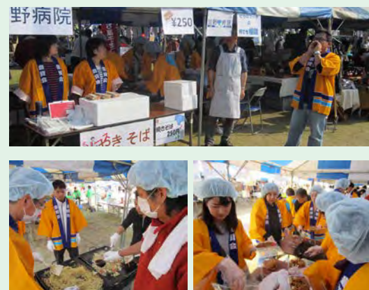
新宮町沖田中央公園

11月新宮中央駅前、沖田公園にて開催された「まつり新宮」に出店しました。まつり新宮は、地域の法人や団体が出店して町の食べ物や特産品などの販売を行ったり、イベントステージでの催しなど、誰でも楽しめる新宮町最大のお祭です。当日は晴天に恵まれ予想を上回る賑わいでした。 豊資会の「名物ソース焼きそば」は行列が出来るほどの好評ぶりです。ピーク時には10分待ちも当たり前前の状態でした。用意した330食も好評のうちに完売して、無事に閉店となりました。ご来店いただきました皆様、ありがとうございました。