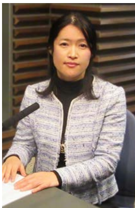
「少しでも気になることがあれば、お気軽にご相談ください。」

「はい。前立腺肥大症は、適切なお薬や治療法などで、早めに治療すれば通常通りの生活を送ることが期待できます。もしトイレのお悩みでお困りの方や、ご本人が症状を放置していることに、ご家族が気付いた場合は、前立腺肥大症を疑っていた方がいいと思います。」