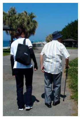
楽しみながら、運動機能の回復が期待できます。

セラピスト・トレーナー・ケアスタッフといった専門職が一丸となって短時間でも楽しく、より効果的なりハビリができるようにサポートしています。ご興味のある方は是非、見学にいらしてください。元気いっぱい笑顔でお待ちしています。