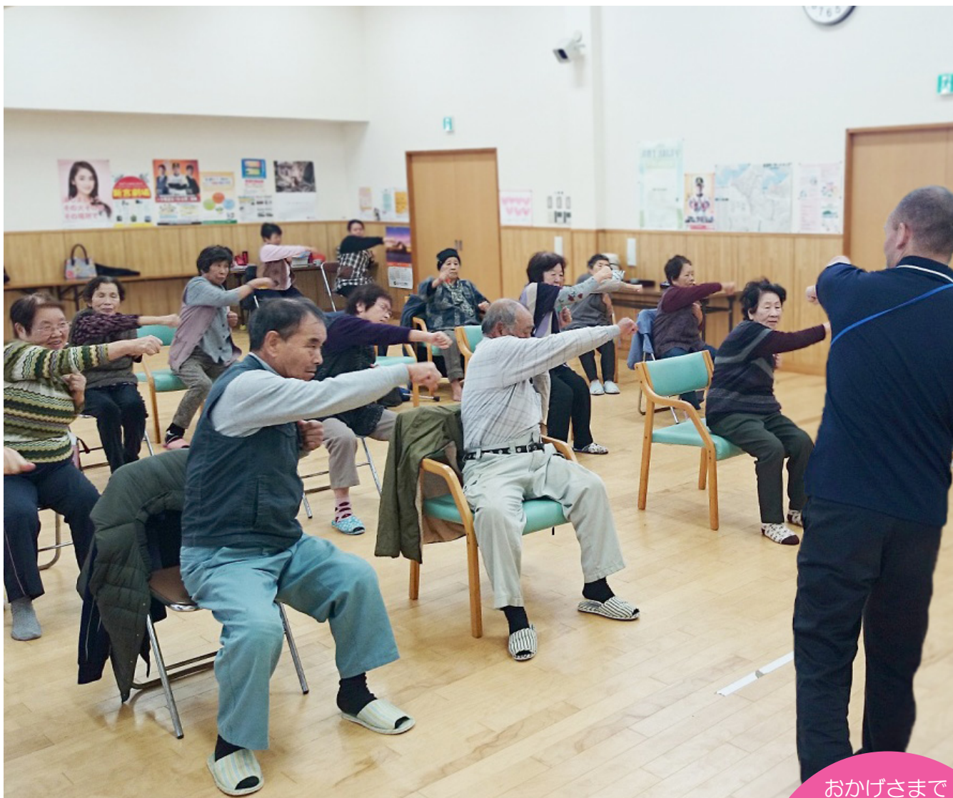
■加野病院リハビリセンター「相島 地域予防事業」