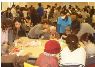
福岡女学院看護大学との交流会は恒例行事となっており、毎回楽しく交流していただいています。