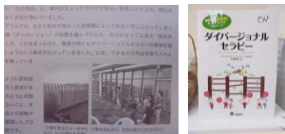
芹澤隆子先生の著書「ダイバーショナルセラピー」でケアハウスどんぐりの実践例が紹介されています。